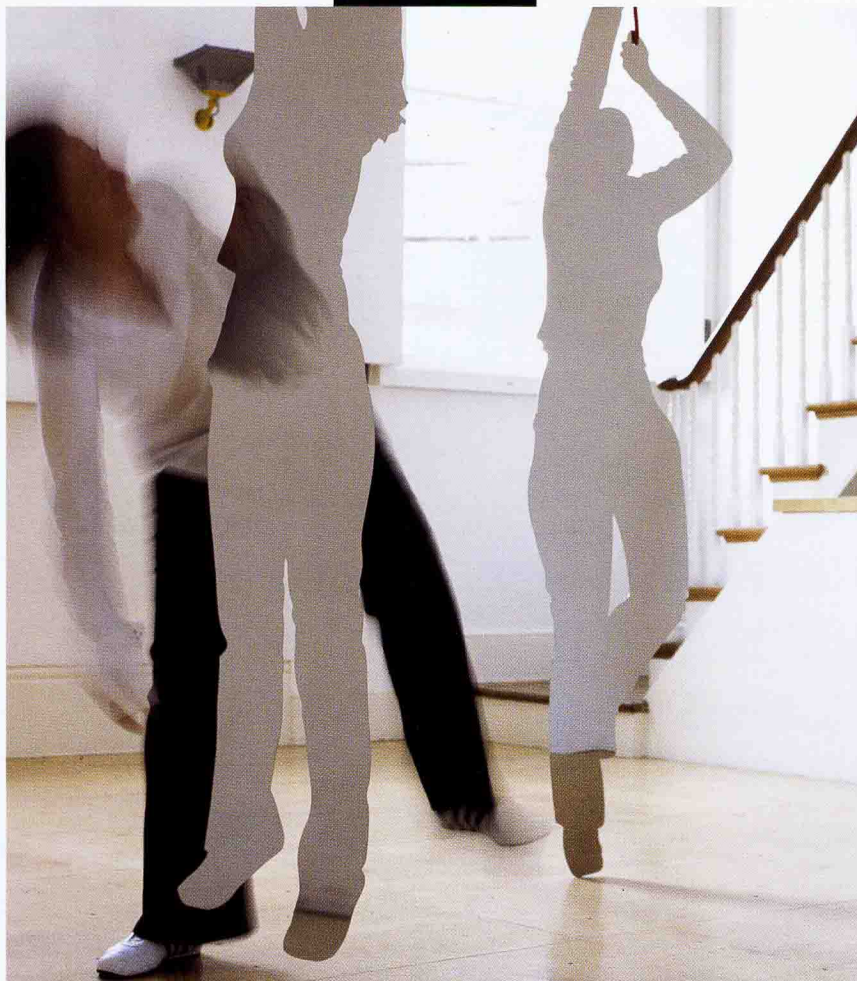
Nerūdijančio plieno veidrodžiai „Pretty Big“