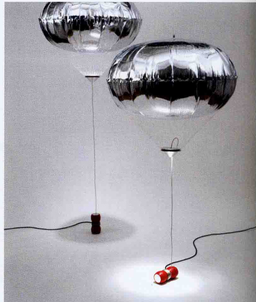
Šviestuvai „World View“