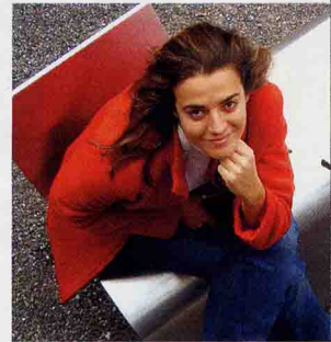
Η μοντέρνα καρέκλα επικοινωνίας με δύο αντικριστά καθίσματα Δεξιά: Φωτιστικά δαπέδου σε σχήμα μπαλονιού

«Δεν σχεδιάζω τίποτε αν δεν καλύπτει τις προσωπικές μου ανάγκες. Αλλη μία καρέκλα γιατί; Υπάρχουν τόσες»