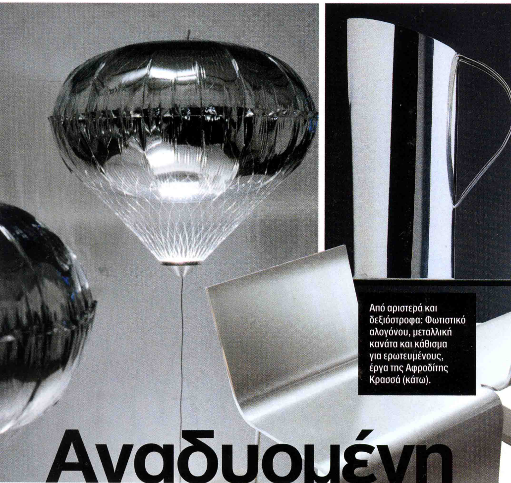
Από αριστερά και δεξιόστροφα: Φωτιστικό αλογόνου, μεταλλική κανάτα και κάθισμα για ερωτευμένους, έργα της Αφροδίτης Κρασσά (κάτω).